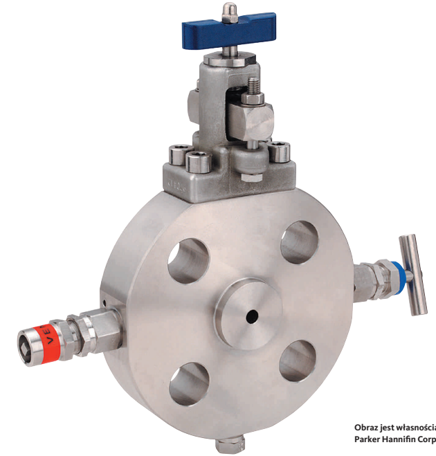
Obraz jest własnością Parker Hannifin Corporation